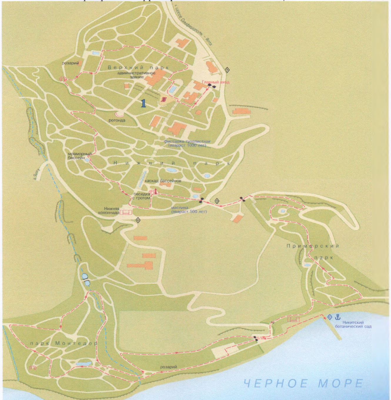
Схема мест организации еженедельных универсальных, постоянно действующих ярмарок на территории ФГБУН «НБС-ННЦ»