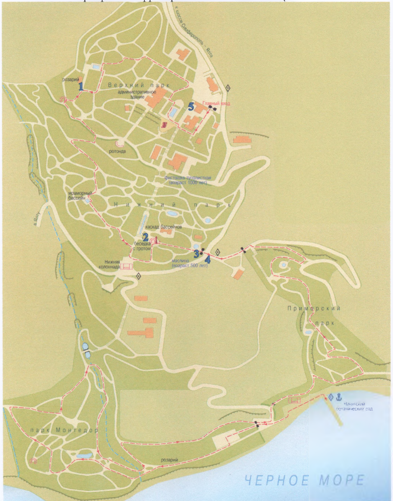
Схема мест организации еженедельных универсальных, постоянно действующих ярмарок на территории ФГБУН «НБС-ННЦ»