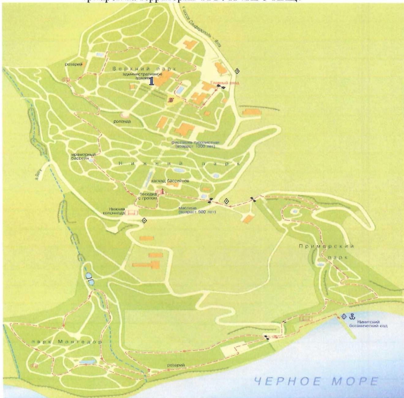
Схема мест организации еженедельных универсальных, постоянно действующих ярмарок на территории ФГБУН «НБС-ННЦ»