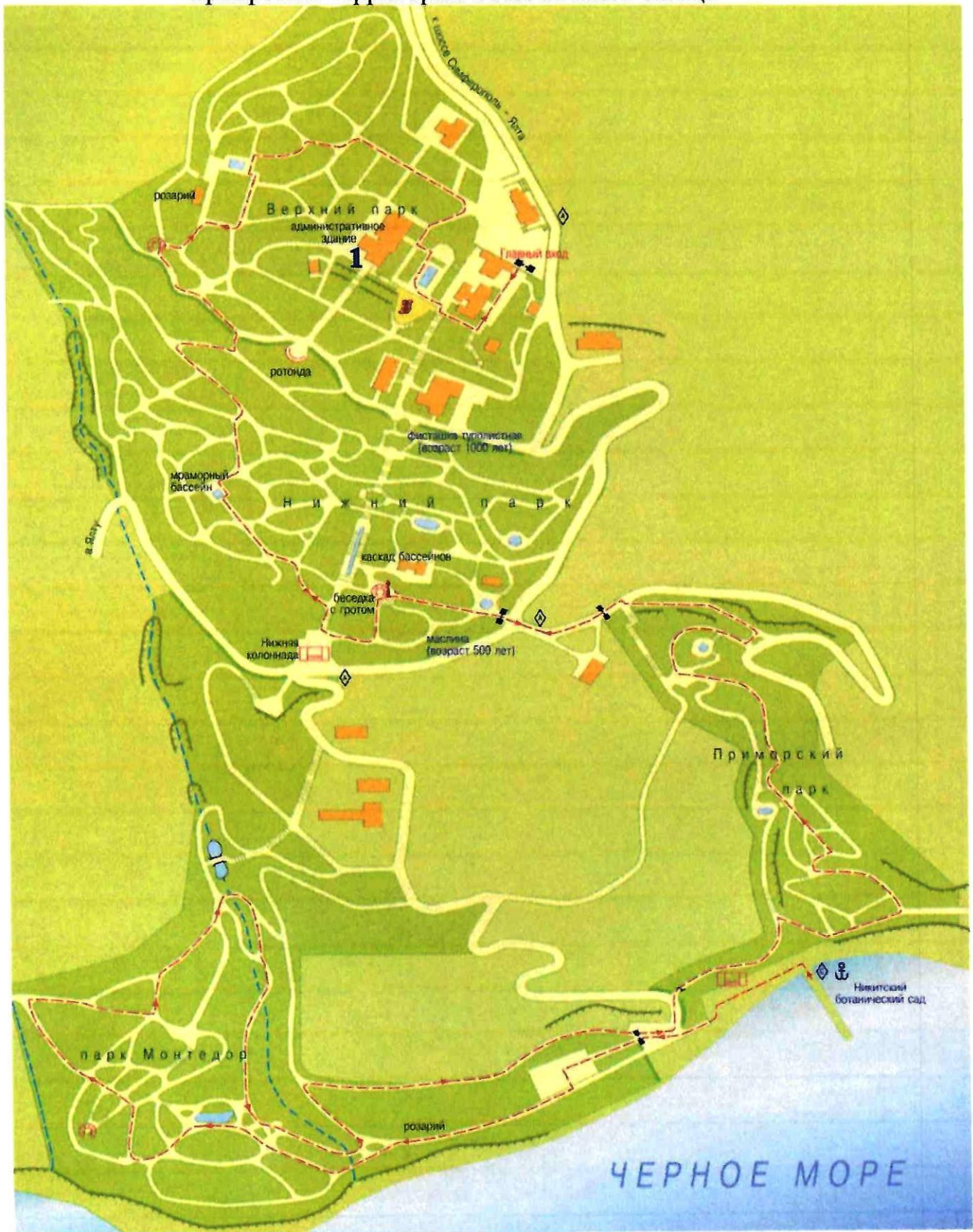
Схема мест организации еженедельных универсальных, постоянно действующих ярмарок на территории ФГБУН «НБС-ННЦ»